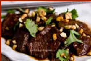
Bò xào cay