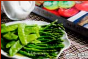
Rau xanh rưới sốt bơ chanh