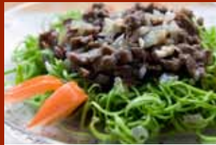
Nộm rau muống thịt bò