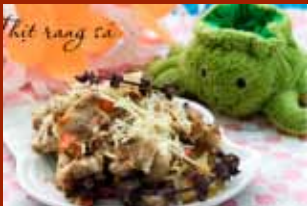
Thịt rang sả