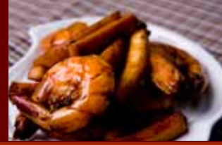
Gà rang hạt điều húng quế