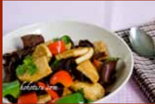
Đậu phụ xào ớt chuông