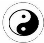
Thái cực đồ

Trong đồ Thái Cực có hai phần bằng nhau : một phần Âm (màu đen) và một phần Dương (màu trắng) bao trong một cái vòng tròn gọi là Đạo (nguyên lý điều hòa và chỉ huy hai lực lượng mâu thuẫn kia).