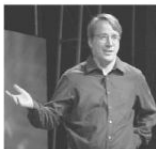
LINUS TORVALDS - NGƯỜI HÙNG PHẦN MỀM MIỄN PHÍ

Giải thưởng Công nghệ thiên niên kỷ (được thành lập năm 2002) do Chính phủ Hà Lan hỗ trợ đã được trao cho Tim Berners-Lee. Ông cũng là người được báo Times năm 1999 bầu chọn là một trong số 100 bộ óc vĩ đại của thế kỷ XX.