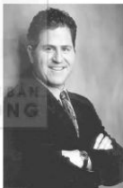
MICHAEL S. DELL - CHỦ TỊCH HÃNG DELL

Ngày nay, hệ điều hành Linux và các “distro” của nó được toàn thể cộng đồng mã nguồn mở ưa chuộng và liên tục phát triển trên khắp thế giới.