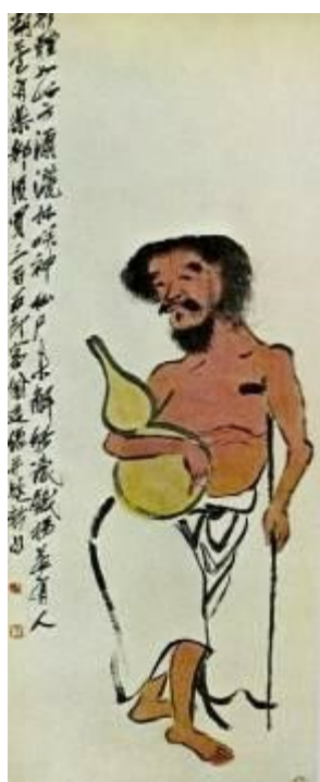
Lý Thiết Quảì - Tranh Tề Bạch Thạch