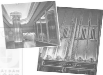
Nội và ngoại thất của một công trình ở New York theo phong cách Art Deco

So với các nước công nghiệp phát triển, Mỹ tiếp cận phong cách hiện đại khá trễ. Dù từ thập niên 1930 các phong cách hiện đại từ châu Âu đã bắt đầu thâm nhập vào đây, nhưng mãi đến sau thế chiến thứ hai, một phong cách hiện đại thuần Mỹ mới chính thức ra đời.