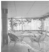
Phòng cách Scandinavian với nội thất trần ngập ánh sáng do Alvar Aalto thiết kế.

Đối với bàn ghế, các nhà thiết kế Scandinavian chú trọng đến công năng sử dụng và sự thoải mái hơn là chạy theo thời trang, họ cũng kết nối hài hòa giữa hai khuynh hướng sản xuất - kết hợp một số cấu kiện làm thủ công với các cấu kiện sản xuất hàng loạt bằng máy móc,