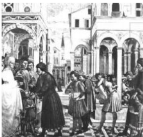
Đi học thời trung cổ - Tranh vẽ thế kỷ XV

nhiều người theo học. Đây cũng là nguyên nhân trọng yếu dẫn đến sự thành lập của những trường đại học ở phía Bắc châu Âu từ thế kỷ XII trở đi.