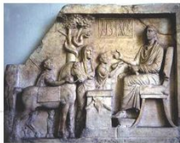
Thầy thuốc với con rắn, cái cây và dụng cụ phẫu thuật (Tranh khắc Hy Lạp, khoảng 323 - 30 trước công nguyên)

Y học, y lý và dược lý Trung Quốc cổ đại khá phong phú và chặt chẽ. Trải qua hàng