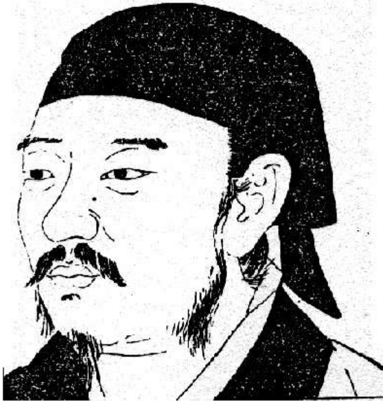
Hình 7. TUÂN TỬ

Rút trong : Trung Quốc Văn Học Sử của Trịnh Chân Đạc quyển 1 (trang 94).