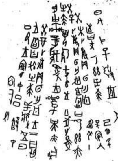
Hình 1. Văn tự dưới thời nhà Ân

Những chữ khắc trên xương thú và mai rùa phát hiện được ở gò nhà Ân.