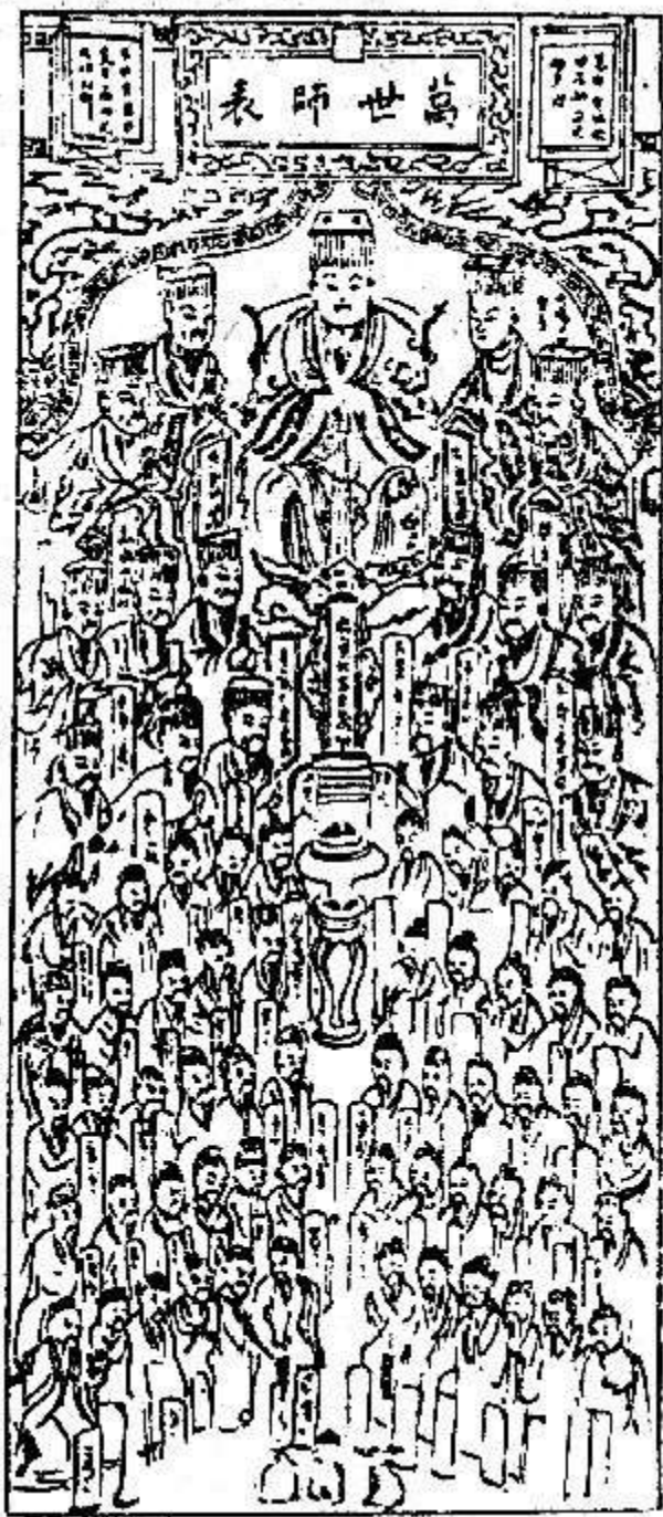
Hình 4. THẤT THẬP NHỊ HIỀN

Đạo của Khổng Tử là "đạo người" mà cũng là đạo của lòng nhơn cho nên Tăng Tử mới nói : "Đạo của Phu Tử là Trung và Thứ mà thôi".