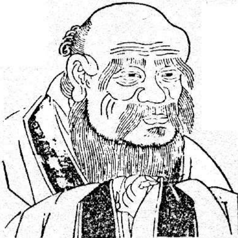
Hình 8. LÃO TỬ