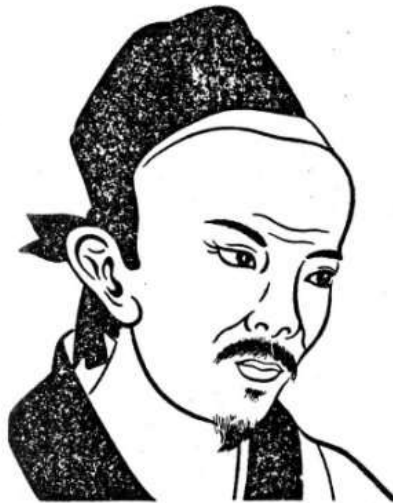
Hình 11. KHUẤT NGUYÊN

Khuất Bình đã bị chê, sau đó, Tần muốn đánh Tê, Tê và Sở Hợp Tung, thân thiện nhau, Huệ Vương lo ngại, liền sai Trương Nghi giả vờ bỏ nước Tần, đem lễ vật trọng hậu đến để xin thờ nước Sở và nói :