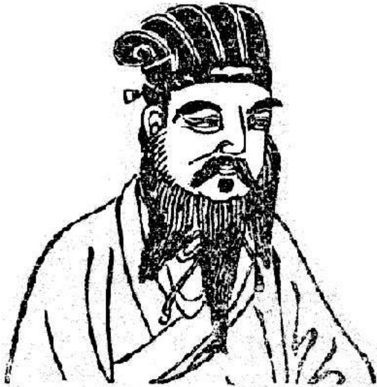
Hình 6. MẠNH TỬ

Theo : Trung Quốc Triết Học Sử Đại Cương của Giản Chi và Nguyễn Hiến Lê, quyển Thượng (trang 433).