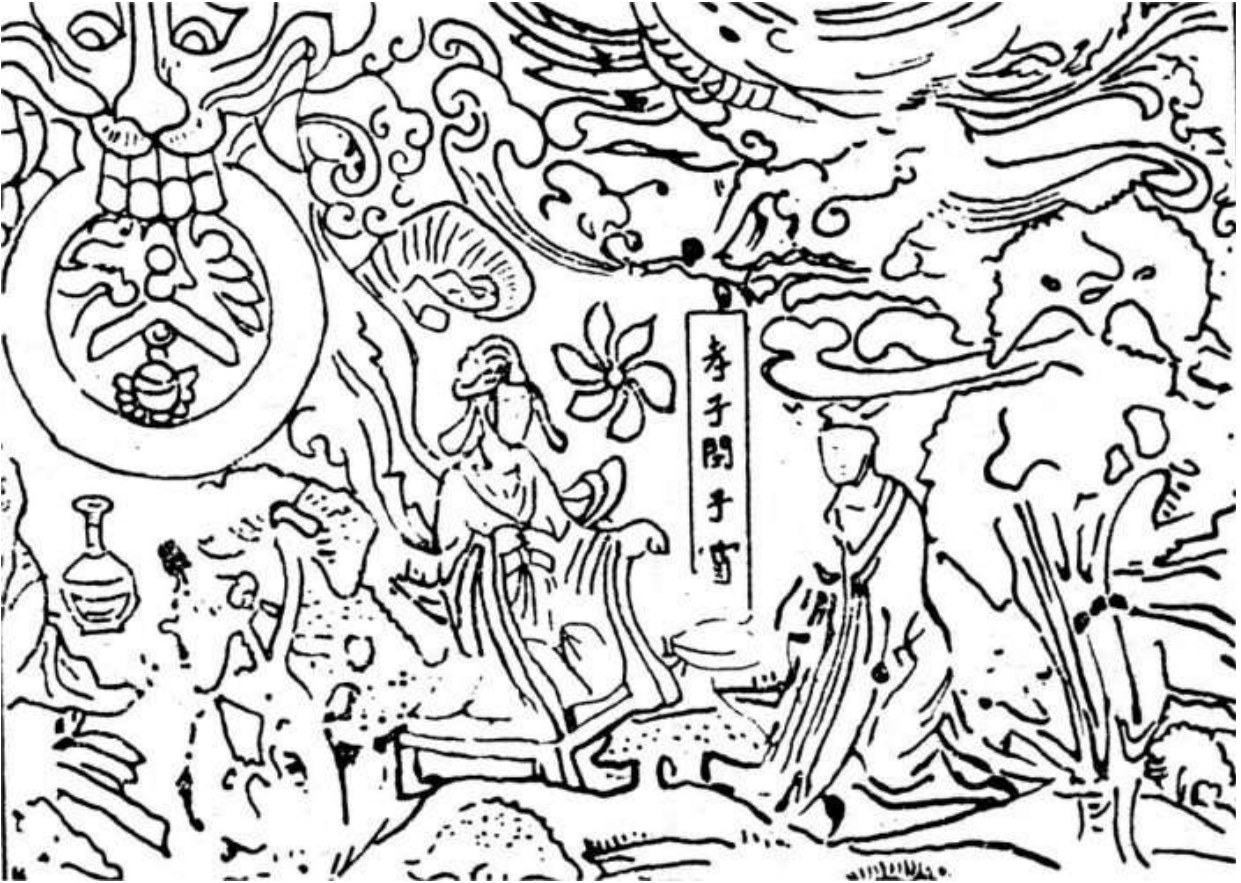
Mẫn Tử Khiên

Theo bản khắc trên đá mộ chí dưới thời Bắc Ngụy (220 T.L) (rút trung Trung Quốc Văn Học Sử của Trịnh Chấn Đạc, quyển 1 trang 127)