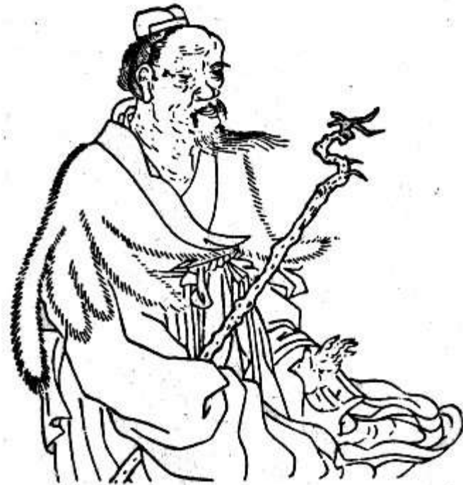
Hình 9 TRANG TỬ